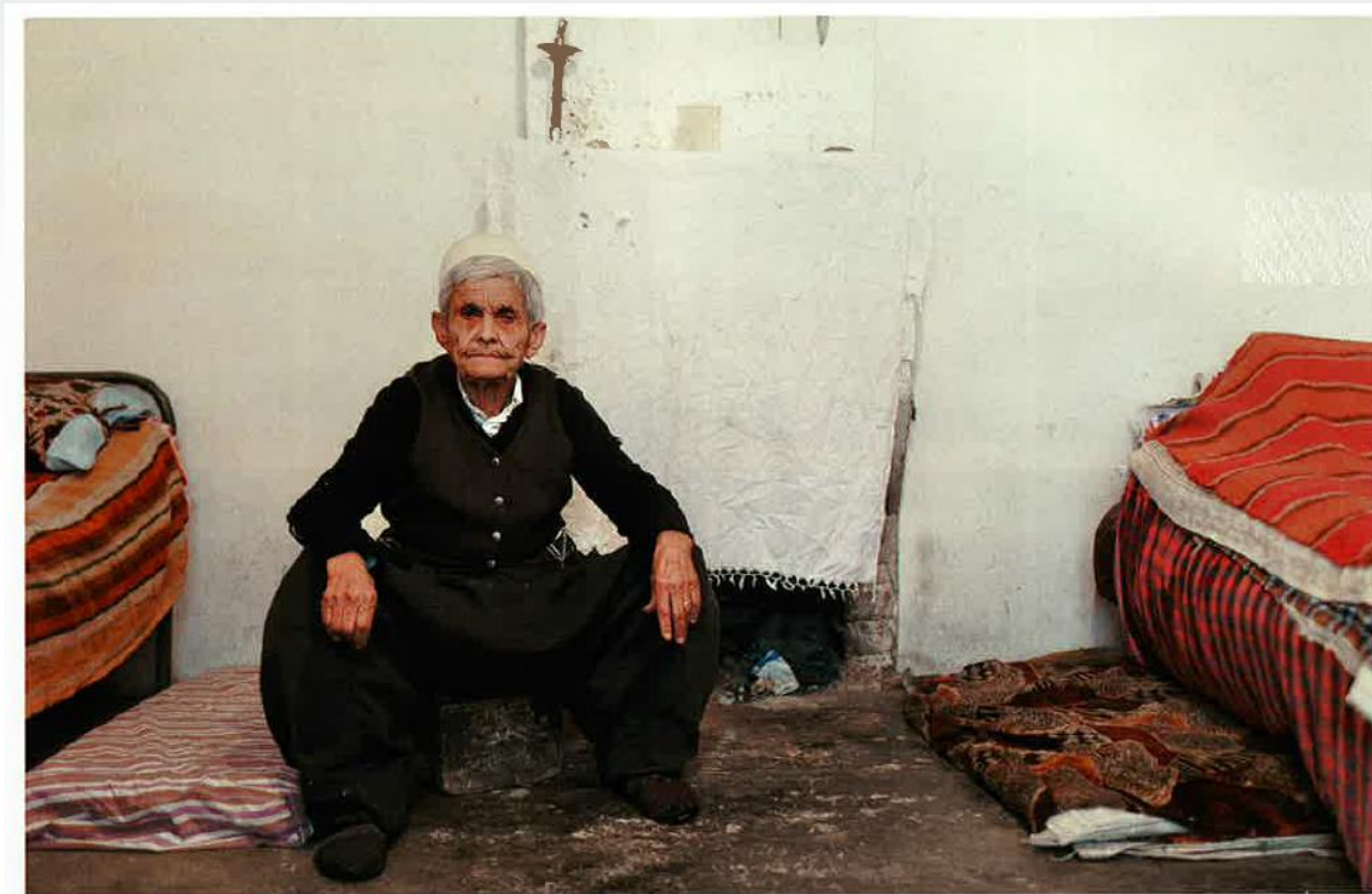
Biologische Frau, sozialer Mann in Albanien